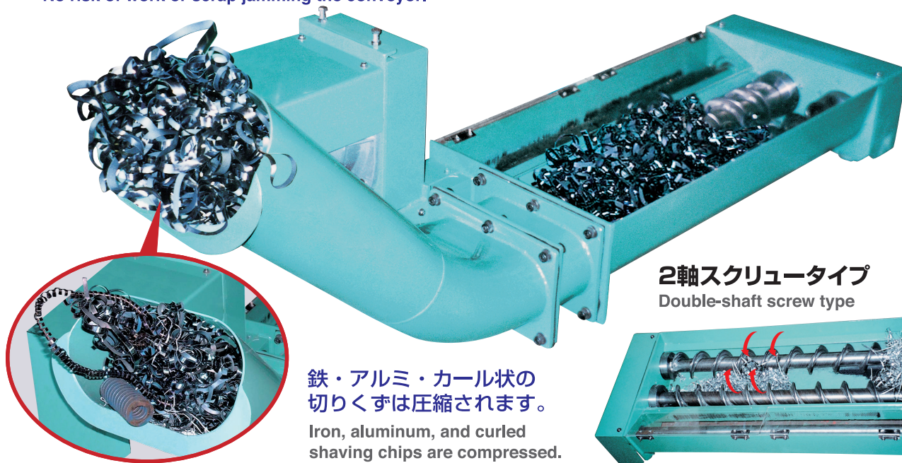
2軸スクリータイプ Double-shaft screw type

Two screw shafts transport large amounts of shaving chips!! No risk of work or scrap jamming the conveyor.